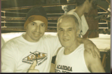
Com o grande lutador Eder Jofre.