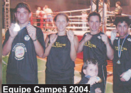
Equipe Campeã 2004.